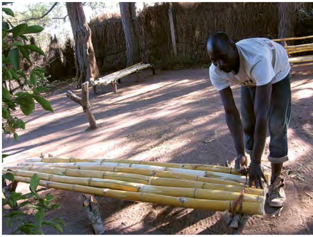
Énók készíti a padokat a kerti bambuszból