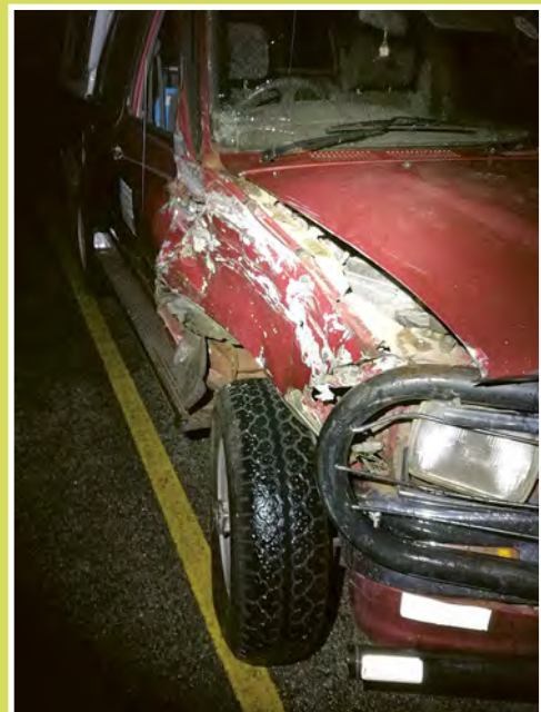
Az összetört autó javítás előtt...