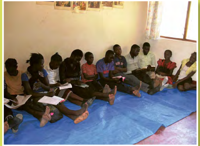
Csendes nap, délelőtti program