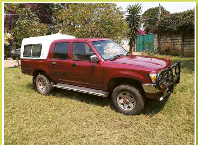
... és javítás után. Hála Istennek!