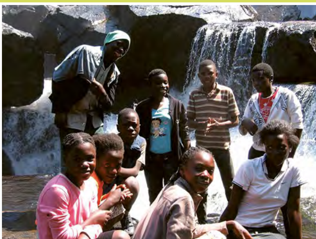
Kirtándulás a Csiszimba-vízeséshez